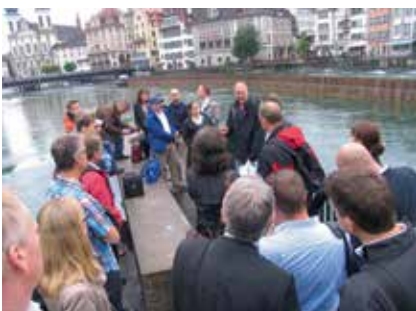
Start der Veranstaltung am Reusswehr.

Die nächste Gelegenheit für Risikomanagement-Interessierte ist die Teilnahme am Lunch-Event «Risiken managen und Chancen nutzen: Ganzheitliches Risikomanagement zur Sicherung von Innovationen» der Hochschule Luzern – Wirtschaft vom 30. Oktober 2013. Informationen findest du auf der Webseite www.hslu.ch/ibr-lunchevent .