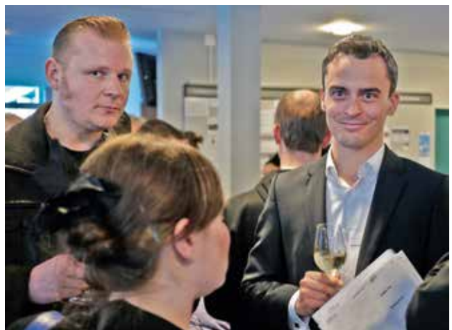
Vorstandsarbeit ist Beziehungsarbeit.