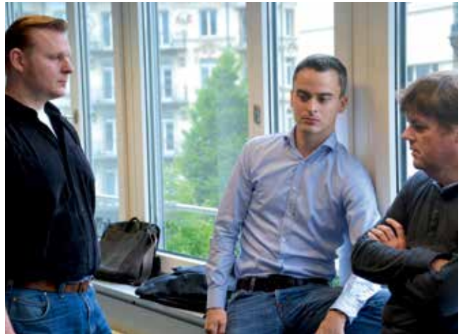
Retraite vom 20. Juli 2013.