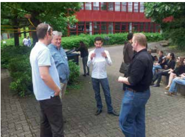
Departementsgruppe Technik & Architektur in Aktion an der Ausstellung der Diplomarbeiten.

Ein grosser Dank geht an dieser Stelle an alle Beteiligten im Vorstand und der Departements- und Themengruppen. Sie opfern für den Verein einen Teil ihrer Freizeit, was neben Beruf und Familie nicht immer einfach ist.