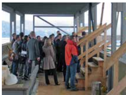
Besichtigung des KKL-Daches.