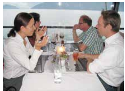
Abendessen auf dem Vierwaldstättersee.