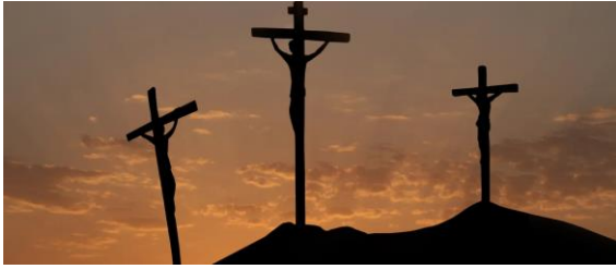
Tiefenstruktur West – Schul - Kreuzigung