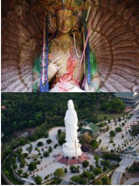
Fachtagung Lösungs- und Kompetenzorientierung - Eine LKO-Geschichtenkiste - mit Gewitztheit zur Lösung - Andreas Stauffer