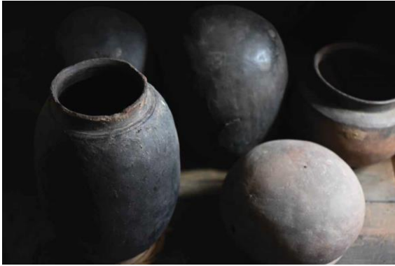
Welche Geschichten gibt es zu erzählen