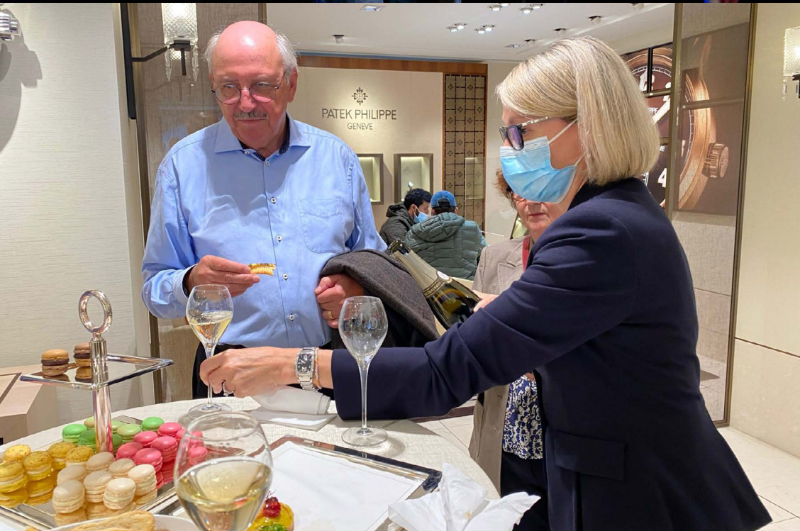
Firmenbesichtigung mit Apéro bei Gübelin