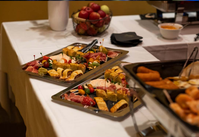
Comedy-Abend mit Lara Stoll im Kleintheater Luzern

Trotz andauernder Corona-Massnahmen konnten 2021 immerhin drei Präsenzveranstaltungen und eine Online-Veranstaltung für die Vereins-Mitglieder durchgeführt werden mit insgesamt 256 Personen. Ergänzend erhielten die Mitglieder wieder besonderen Zugang oder Rabatte bei Angeboten der Hochschule oder externen Anbietern. Wie stets haben die Veranstaltungen das Ziel, informativ zu sein und das Netzwerken unter den Mitgliedern zu fördern. Das Angebot umfasste Betriebsführungen, Rundgänge an kulturellen Veranstaltungen, einen Werkstattbesuch an der HSLU – Design & Kunst, sowie die beiden grösseren Anlässe Comedy-Abend und Neujahrsapéro.