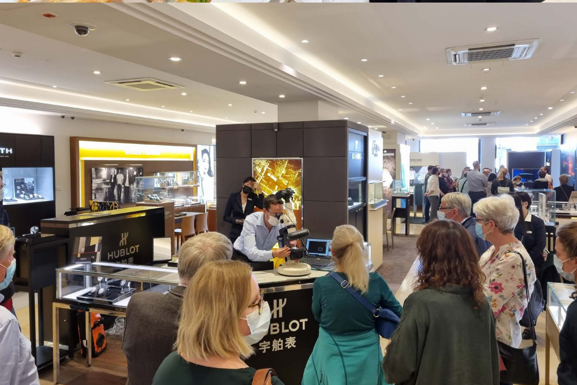
Firmenbesichtigung mit Apéro bei Gübelin