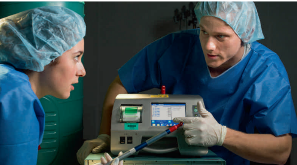
Ingenieurinnen und Ingenieure der Medizintechnik entwickeln innovative Medizinprodukte – der Bachelor-Studiengang vermittelt das fachliche Know-how dazu.

Die Hochschule Luzern – Technik & Architektur bietet per Herbstsemester 2015 ein neues Studienangebot in Medizintechnik an und bildet damit gesuchte Ingenieurinnen und Ingenieure für eine zukunftsorientierte Branche aus.