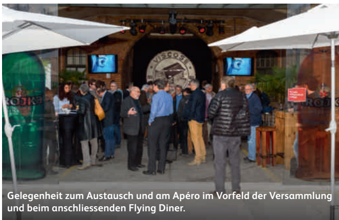
Gelegenheit zum Austausch und am Apéro im Vorfeld der Versammlung und beim anschliessenden Flying Diner.