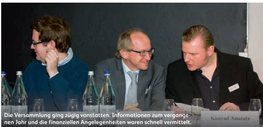
Die Versammlung ging zügig vorstatten. Informationen zum vergangenen Jahr und die finanziellen Angelegenheiten waren schnell vermittelt.