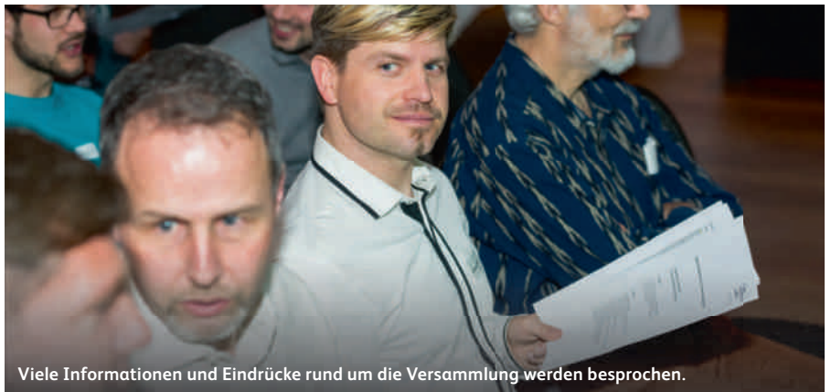
Viele Informationen und Eindrücke rund um die Versammlung werden besprochen.