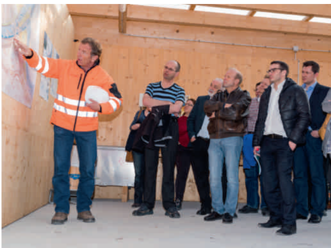
Alumni besuchen die Baustelle Seetalplatz vor der Vereinsversammlung.